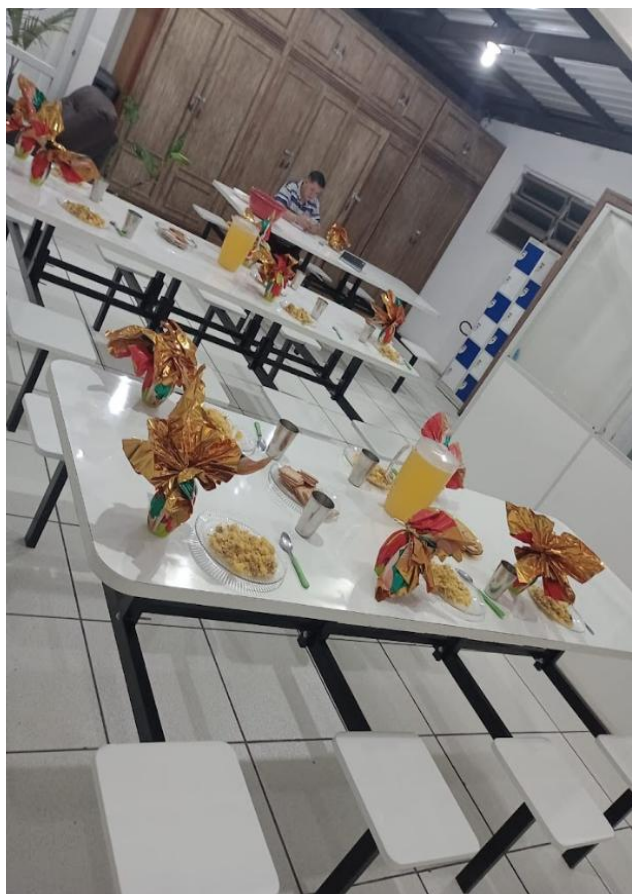
Figura 5: Comemorando a Páscoa - 20/04/2025