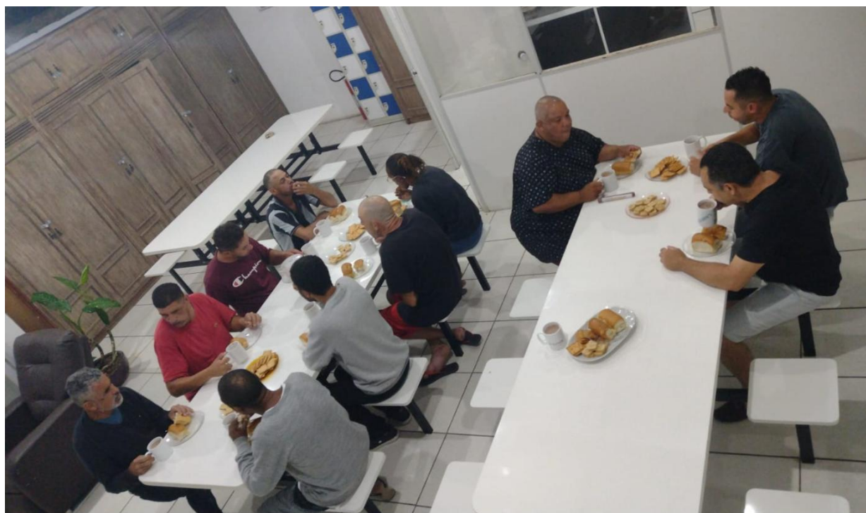
Figura 4: Lanche da Noite, 15/04/2025