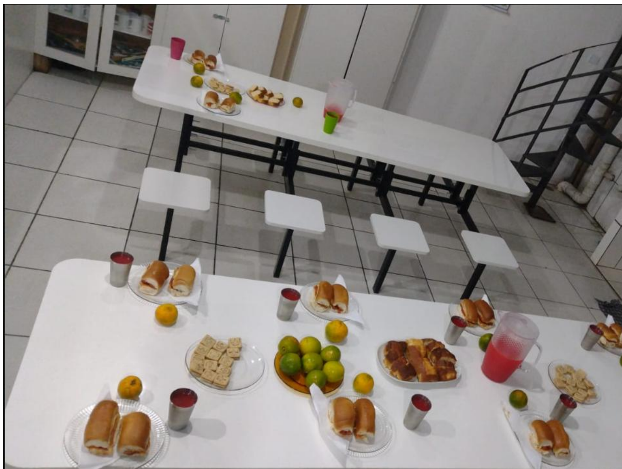
Figura 7: Café da Manhã, 30/04/2025