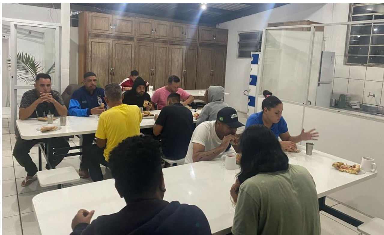
Figura 2: Café da Noite, 10/04/2025