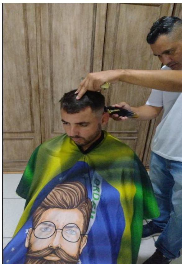
Figura 1: Corte de Cabelo com voluntário, 03/04/2025