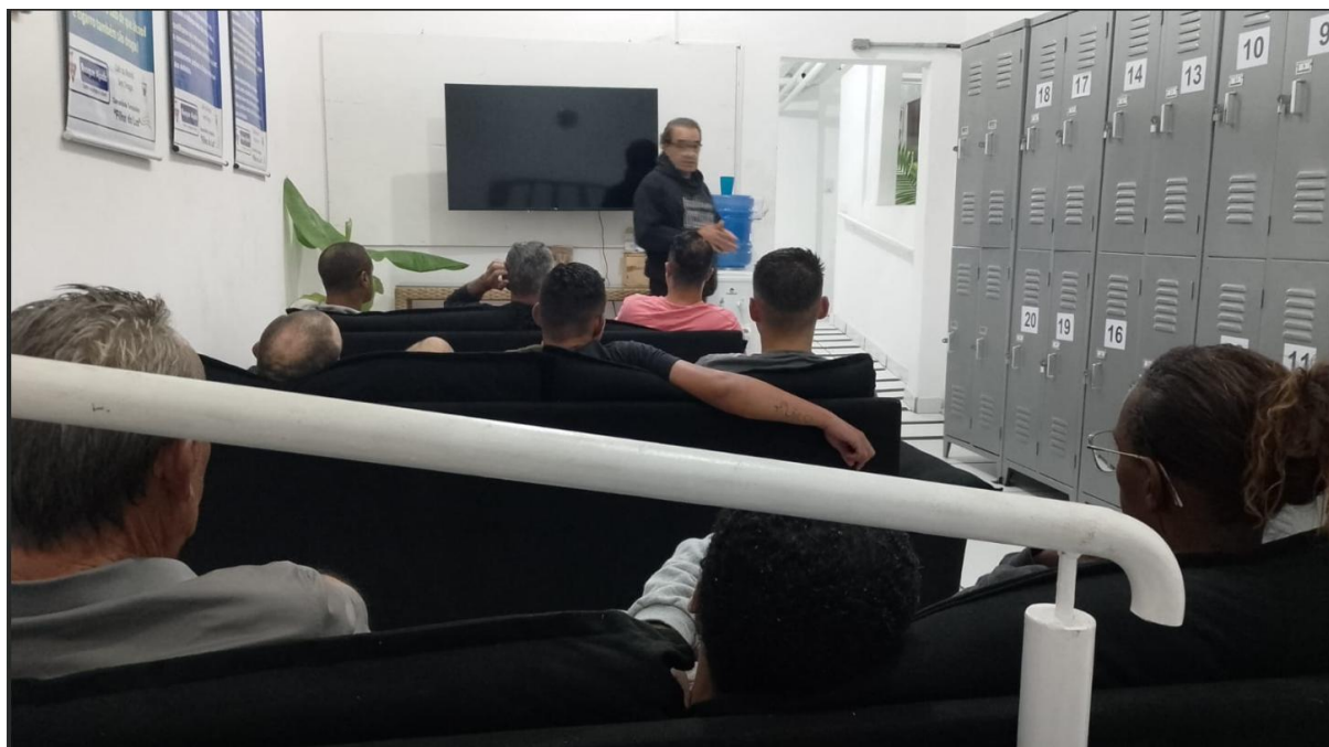
Figura 3: Reunião de Conscientização, 14/04/2025