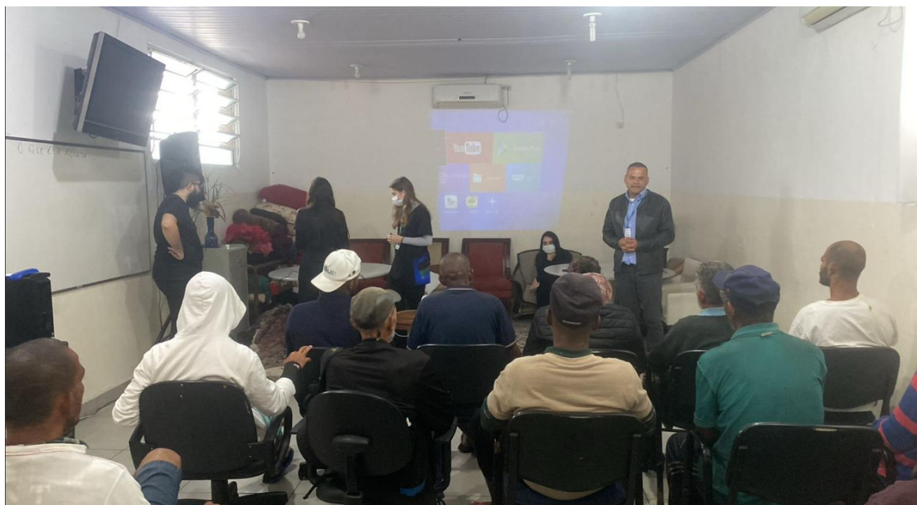
Figura 6: Evento feito pelo Centro POP e estudantes de medicina no Albergue - 25/04/2025